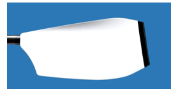
Fat Smoothie (Vortex エッジあり)

大半が Ice Blue 33.5mm です。グリップはお好みに応じて選択してください。