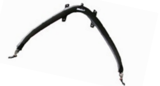
カーボンパウウイングリガー