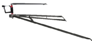
アルミパイブリガー