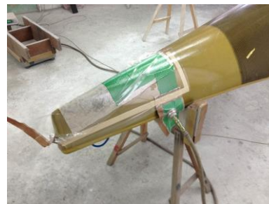
写真: 修理中のカヌー

このFAX通信はボート関係だけでなく、カヌー関係の団体様にも適宜配信させて頂いております。それでも9割以上の記事がボート関係なので、カヌー関係の方にはいつもちょっと申し訳ないなと気がかかっています。現在弊社では各種カヌーの補修・整備・改良なども承っております。ほとんどが他社艇のため、時にできる範囲に限られることもありますが、お客様とキャッチボールしながらベストメンテを心がけています。先日、いくつかの大会で、弊社にて修理させて頂いた艇を使って、優勝・入賞、選考通過した、とお客様からの連絡がありました。「おめでとうございます」と思うと同時に、修理した側として「ほっとした!」という気持ちも湧いてきます。リピートしていただけるお客様、お知り合いを紹介して下さるお客様が少しずつ増えていることを励みに、パドルスポーツ全般に貢献していきたく思います。