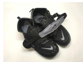
NIKE OMADA3/黒 11,000円【税別】