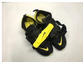
NIKE OMADA3/黄 20,000円【税別】