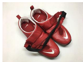
NIKE OMADA2/赤 11,000円【税別】