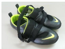
NIKE OMADA2/黒 20,000円【税別】

NIKE シューズの特価販売致します。在庫限りにつきサイズに限りがございますので、ご注文の際はお早めに。また、甲の幅が狭くなっていますので、1サイズ大きいサイズを選択されることをお勧めします。ご不明な点など御座いましたら、お気軽にお申し付けください。