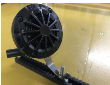
ギャレールに取付可能